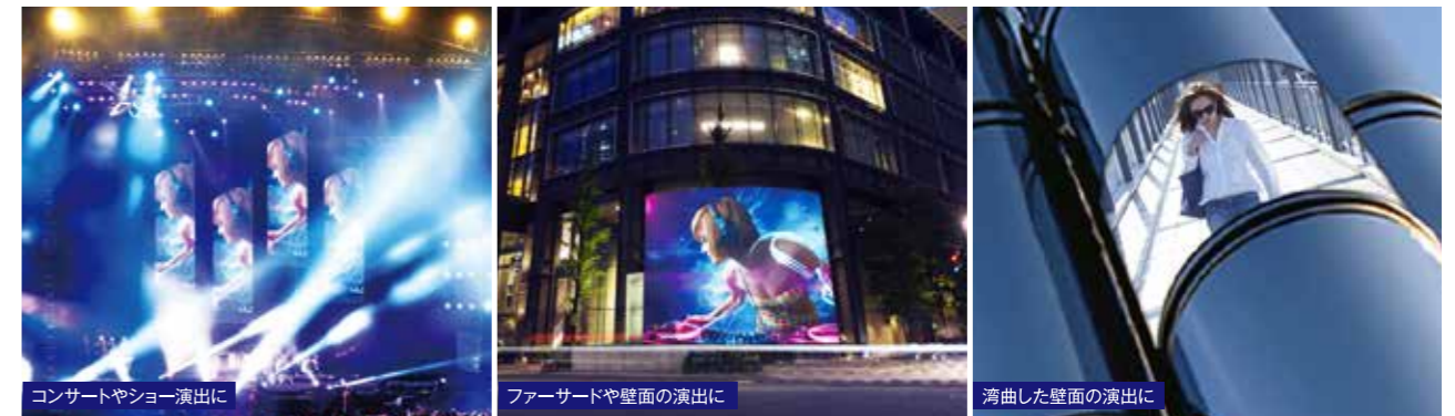
コンサートやショー演出に