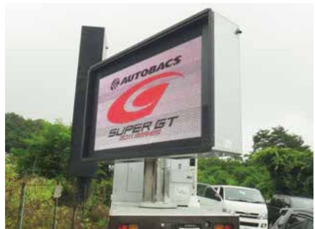
▲ SUPER GT

最新の8mmピッチBlackSMDをビルトインした高輝度、高画質を実現する「パノラマビジョンジュニア2号機」。190インチの画面に「90度回転機構」と「リフトアップ機構」を採用。パノラマビジョンジュニア1号機同様に、4t車をベースとして機動力を大幅に向上。プロモーション等のあまり条件の良い設置環境においても「2つの機能」が常に100%に近い能力を発揮。見る人に適格な情報と感動を与えることができる映像システムです。