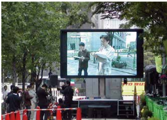
▲ 自転車スプリントGP in 丸の内

90度の回転機構に加え、 リフトアップ機構を装備。 多彩な設置環境に対応できる 8mmピッチLED映像システム。